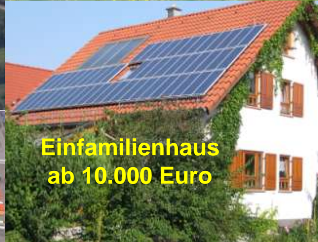
Einfamilienhaus ab 10.000 Euro