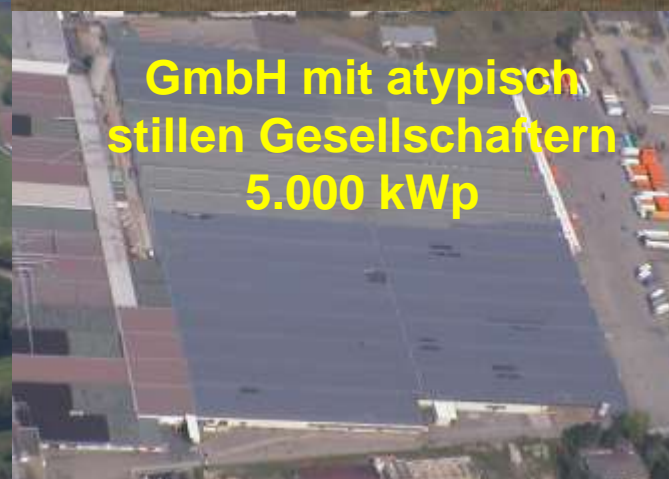
GmbH mit atypisch stillen Gesellschaftern 5.000 kWp