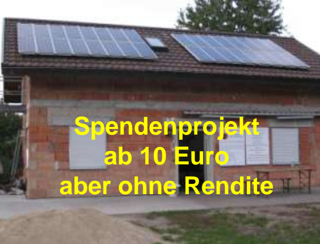
Spendenprojekt ab 10 Euro aber ohne Rendite