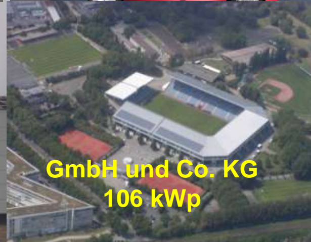
GmbH und Co. KG 106 kWp