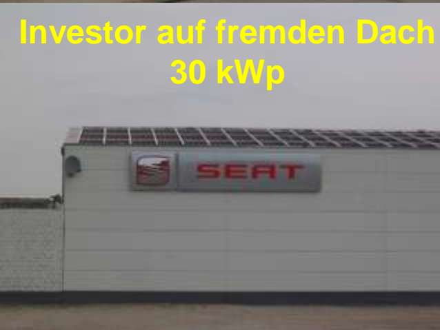
Investor auf fremden Dach 30 kWp