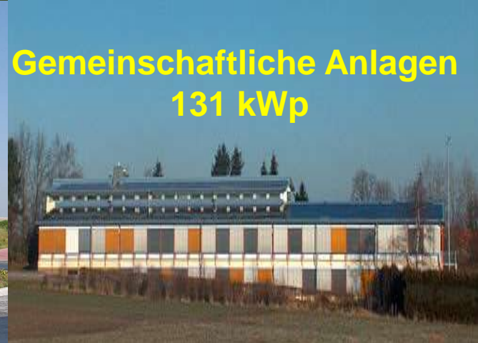
Gemeinschaftliche Anlagen 131 kWp