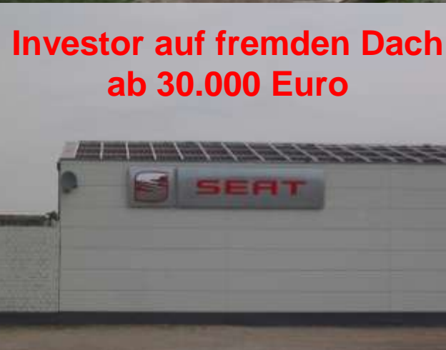
Investor auf fremden Dach ab 30.000 Euro