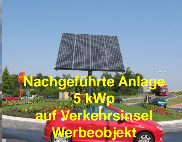
Nachgeführte Anlage 5 kWp auf Verkehrsinsel Werbeobjekt