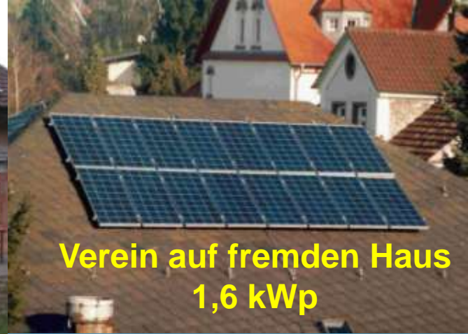
Verein auf fremden Haus 1,6 kWp