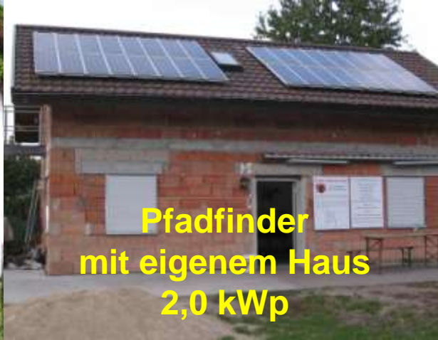
Pfadfinder mit eigenem Haus 2,0 kWp