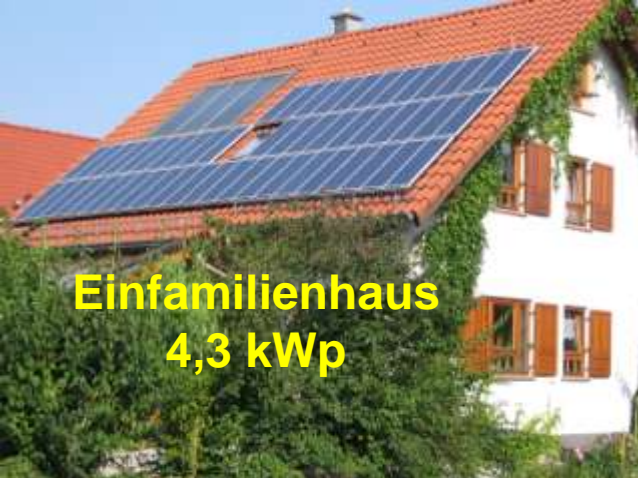
Einfamilienhaus 4,3 kWp