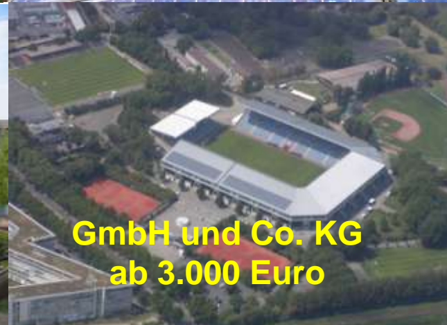
GmbH und Co. KG ab 3.000 Euro