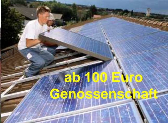
ab 100 Euro Genossenschaft