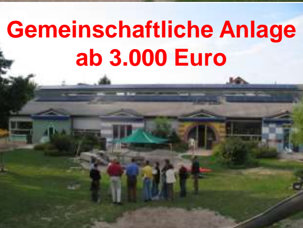
Gemeinschaftliche Anlage ab 3.000 Euro