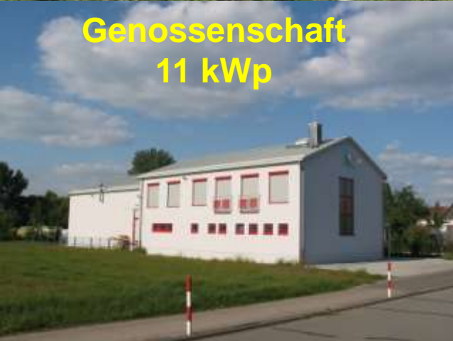
Genossenschaft 11 kWp