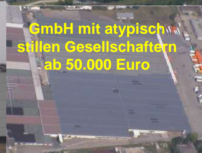
GmbH mit atypisch stillen Gesellschaftern ab 50.000 Euro